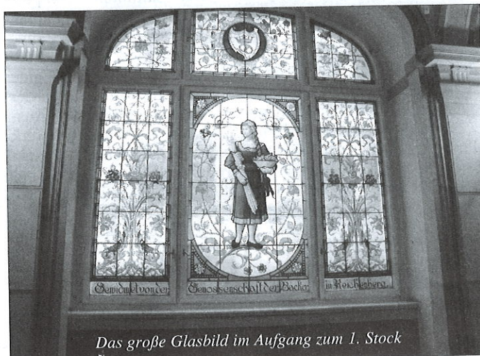
Das große Glasbild im Aufgang zum 1. Stock

Die Räume im Inneren des Rathauses, im romanischen Stil des Histori(z)smus ausgestaltet, zeugen von der kunsthandwerklichen Meisterschaft der Bürger Reichenbergs und seiner näheren und weiteren Umgebung. Die Marmortreppe zur 1. Etage heraufschreitend, strahlt eine Frau mit einer Getreidegarbe in den Armen an, dargestellt in einem Buntglasfenster, das die hiesige Bäckerinnung gestiftet hatte. Und es gibt noch viele weitere schöne