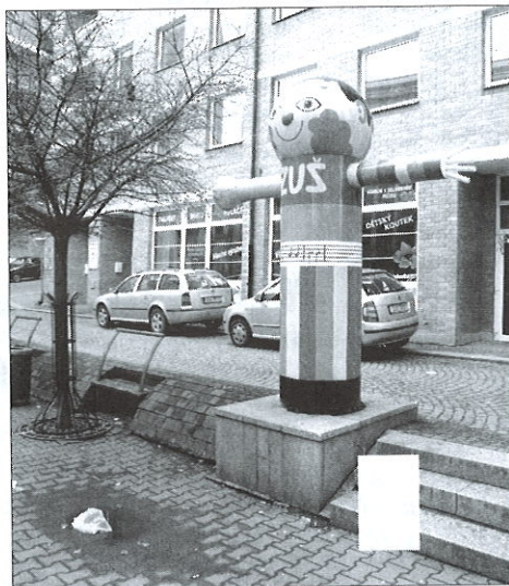
„Kein Mensch ist so ein Dummkopf, dass er nicht wenigstens in einer Sache Erfolg erzielte, sobald er nur genügend Ausdauer beweist.“ Zitat v. Leonardo da Vinci auf dem Eingang des Schulgebäudes.